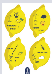
נספח מספר 1